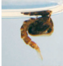
▲ Pupa del mosquit tigre.

El mosquit tigre ( Aedes albopictus ) és originari del Sud-est asiàtic. L'estiu de 2004 es va detectar per primera vegada a Catalunya.