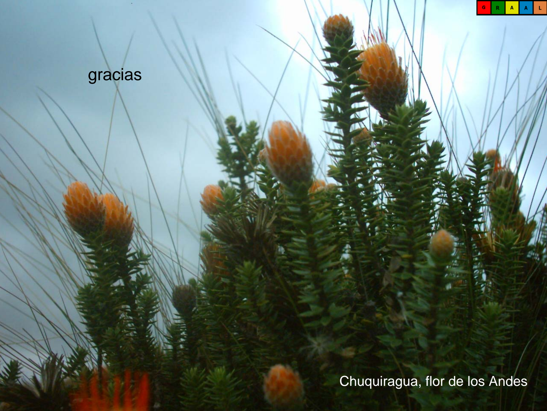
Chuquiragua, flor de los Andes