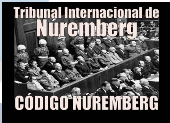
Juicios de Nuremberg, dónde nació el consentimiento informado