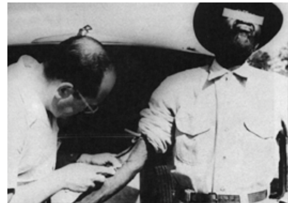
Estudios sobre sífilis en Tuskegee